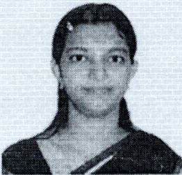
RUPA V 06PU005 G.C.P. B'lore