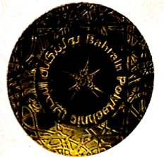
Director of Admission and Registration